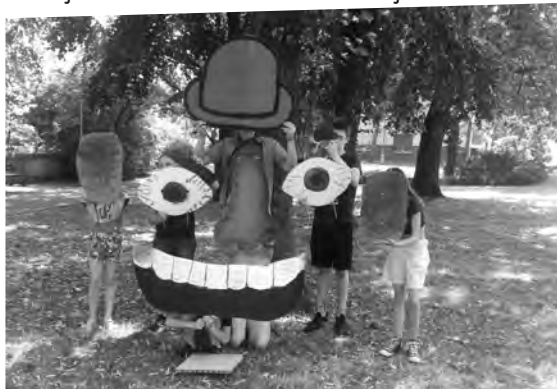
Dušan ze semináře Cirkus

Sportovní redakce Blekotaje vyhláší závod ve zodpovězení kvízové otázky, vztahující se k předešlému článku. Vy, přátelé divadelních štafet a loutkových maratonů, kteří se jako první dostavíte do okénka redakce ve chvíli, kdy bude u stolu sedět někdo z našeho manšaftu a řeknete nám jméno Muže, který je slavný, a o němž psal Adam Češner ve druhém čísle tohoto plátku, získáte cenu dle vlastního výběru. Náповěda: program včerejšího dne a druhé číslo Blekotaje.